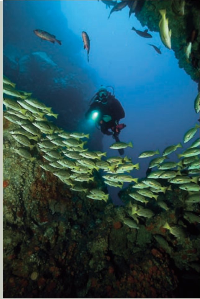
Vissen waren in grote getallen aanwezig.