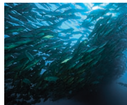
Voedselvoor de haaien was er in ieder geval genoeg aanwezig.