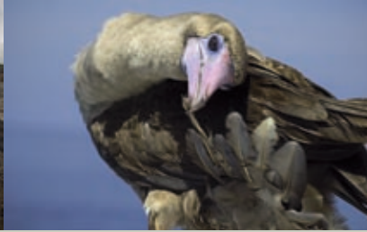
Op het gebied van bovenwater natuur hebben de Cocos eilanden ook heel wat te bieden.