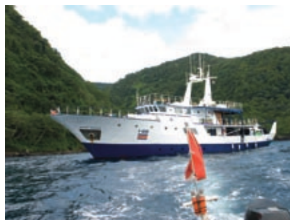
Het schip Okeanos Aggressor.

Het schip Okeanos Aggressor (Aggressor fleet) was helemaal gecharterd voor ons en ik stond daar als kleine 2*Duiker tussen een bende zware jongens van 1* en 2*Instructeurs. Daar bovenop dan nog een tweevoudig wereldkampioen onderwaterfotografie (Rudy Van Geldere). Gelukkig gaf mijn aantal duiken (400) hen terug wat meer vertrouwen over mijn persoon en kunde.