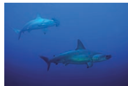
Een school van ontelbare hamerhaaien boven je hoofd, is een fantastische belevenis.