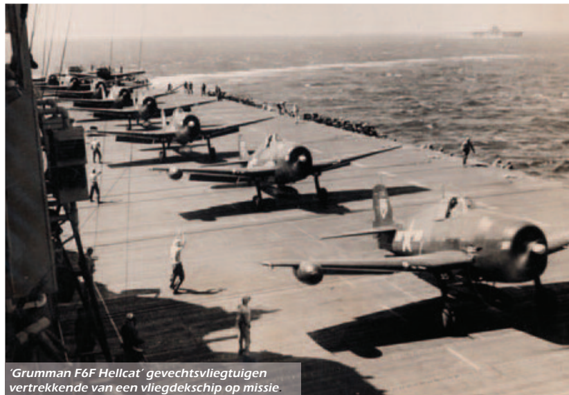
'Grumman F6F Hellcat' gevechtsvliegtuigen vertrekkende van een vliegdekschip op missie.