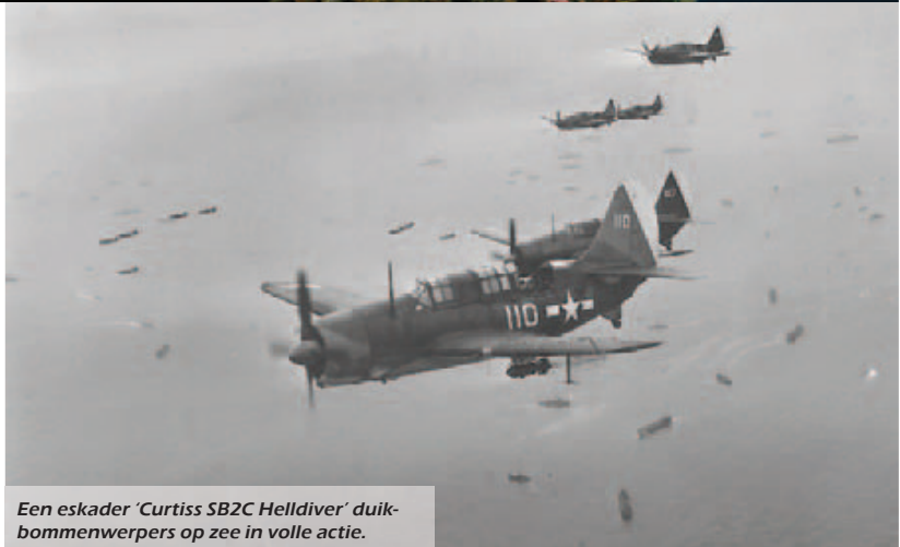
Een eskader 'Curtiss SB2C Helldiver' duikbommenwerpers op zee in volle actie.

Sangat Island heeft het grote comfort dat