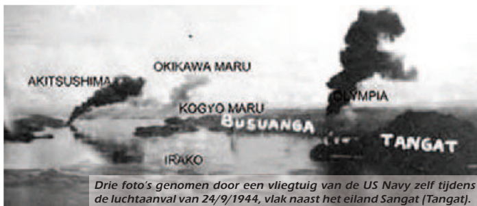
Drie foto's genomen door een vliegtuig van de US Navy zelf tijdens de luchtaanval van 24/9/1944, vlak naast het eiland Sangat (Tangat).

De Japanners moesten meer en meer wijken. In februari 1944 kreeg Japan al met een eerste eigen en enorme Pearl Harbour-tragedie te maken op haar belangrijke militaire basis/haven van Truk Lagoon in Micronesië. De weerwraak van de Amerikanen begon zoet te smaken. Op dat ogenblik beseften de Japanners evenwel nog altijd niet het belang van DOB, Dispersed