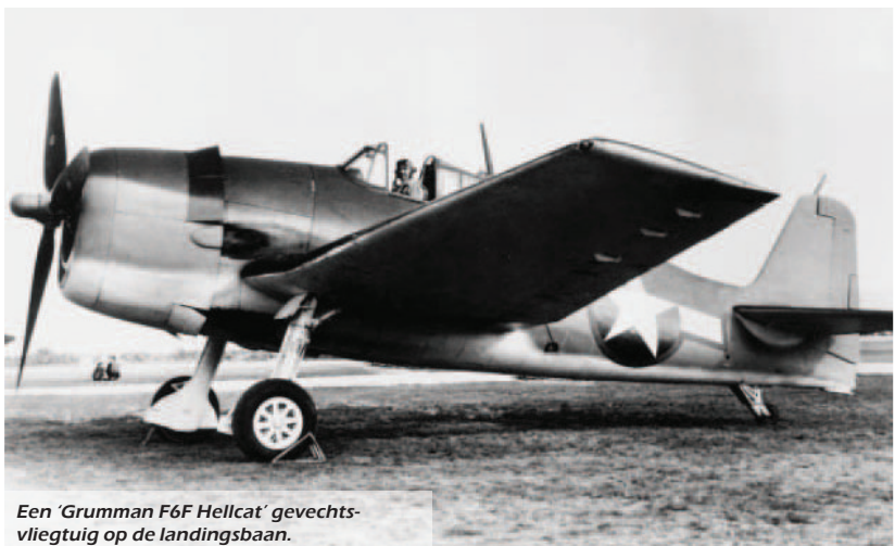
Een 'Grumman F6F Hellcat' gevechtsvliegtuig op de landingsbaan.